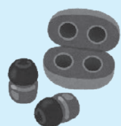
ワイヤレスイヤホン