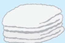
タオル・ バスタオル